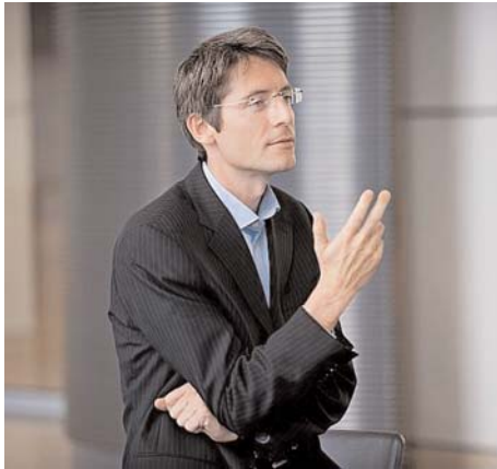
Sven Schulz ist Spandauer Bundestagsabgeordneter.

3. Ein Weiteres kommt hinzu: Wie gehen wir mit den Menschen um? Sprechen wir mit ihnen? Hören wir uns an, was sie zu sagen haben oder wollen wir ihnen Politik von oben verordnen? Das fängt übrigens innerhalb der SPD an. Einen wesentlichen Grund für diese Niederlage sehe ich darin, dass die Partei- und Regierungsspitze zu wenig diskutiert hat. Wir müssen wieder mehr mit den Menschen sprechen, uns mit ihnen zusammensetzen, auch gesellschaftliche Gruppen ansprechen.