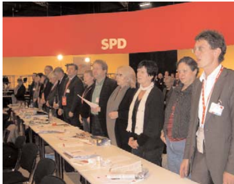
Bundesparteitag in Dresden.

Eva Högl, Mitglied des Parteivorstands, Bundestagsabgeordnete: „Der Bundesparteitag in Dresden hat ein klares Signal für die programmatische und personelle Erneuerung der SPD gegeben. Die Stimmung unter den Genossinnen und Genossen war sehr gut, die Atmosphäre geprägt von offenem Meinungsaustausch und konstruktiven Debatten mit notwendiger Kritik und klarer Perspektive. Ganz persönlich habe ich mich über die große Unterstützung und das mir entgegengebrachte Vertrauen bei der Wahl zum Parteivorstand gefreut. Als Mitglied des neuen Vorstandes werde ich mich aktiv an der Erneuerung der SPD beteiligen und hier die Erfahrungen aus meiner Arbeit im Bundestag ebenso nutzen wie die Eindrücke aus meinem Wahlkreis. Gerade die Verzahnung zwischen Parteivorstand und den Abteilungen und Mitgliedern der SPD Berlin ist mir dabei ein besonders Anliegen. Wir wollen die Ideen sowohl unserer Mitglieder als auch gesellschaftlicher Gruppen hören und gemeinsam unsere SPD wieder nach vorne bringen! Mir liegt es sehr am Herzen, dass wir zu einem besseren Umgang miteinander finden. Sigmar Gabriel hat in seiner Rede