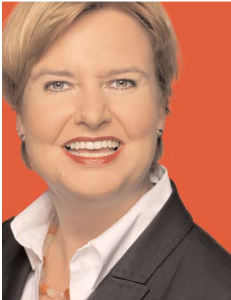
Eva Högl ist Mitglied des Parteivorstands und direkt gewählte Bundestagsabgeordnete in Mitte.

Als ASF-Landesvorsitzende kritisiere ich besonders die mangelhafte Durchsetzung unserer Forderungen in Sachen Gleichstellung. Bei den Themen Entgeltgleichheit, Steuerrecht, Gleichstellung in der Privatwirtschaft und Führungspositionen kön-