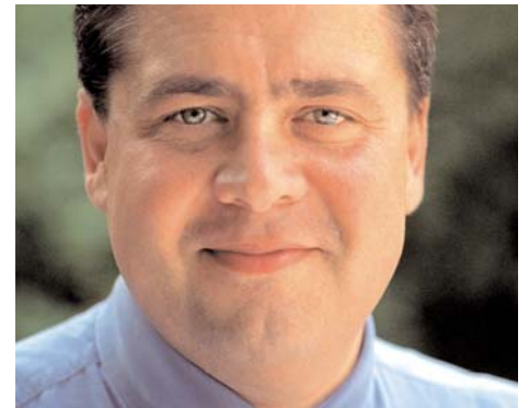
94,2 Prozent Zustimmung: Sigmar Gabriel ist neuer Vorsitzender der SPD.

Für die Erarbeitung ihrer Konzepte wird sich die SPD Zeit nehmen. Gabriel warb dafür, die SPD zu einer „Politikwerkstatt für gesellschaftlichen Fortschritt“ zu machen. Sie müsse eine Partei sein, die Menschen einlädt, mitzumachen, und nicht den An-