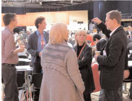
Bundesparteitag: Michael Müller und Berliner Delegierte.

Gabriel rief die SPD dazu auf, wieder um die Deutungshoheit zu kämpfen. Dann gewinne man auch die vielbeschworene Mitte. Gabriel: „Seit bald 20 Jahren geht ein neues Gespenst um in Europa: das Gespenst der politischen Mitte, genauer gesagt: der neuen Mitte. Alle reden über sie, alle reklamieren sie für sich. Alle meinen sie zu kennen, ohne allerdings genau erklären zu können, wer oder was die Mitte ist oder wofür die politische Mitte steht. Auch wir haben die politische Mitte für uns reklamiert und haben sie mehrfach in der Nachkriegsgesellschaft gefunden: in den 70er-Jahren durch Willy Brandt, später durch Helmut Schmidt und auch durch