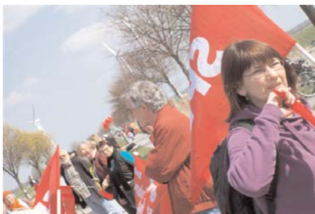
120.000 Atomkraftgegner kamen zur Menschenkette.

Die beschauliche Landstraße ist voll mit Leuten; rote, grüne, bunte Fahnen wehen, doch es gibt noch Lücken. Ob wir es überhaupt schaffen, die Kette zu schließen? Mir wird ein bisschen schwindlig vom Klimawandel: Es ist ein merkwürdiges Gefühl, unvermittelt von der lauten Großstadt in dieser Stille bei Kühen und Wiesen auf dem Lande zu stehen. Doch still bleibt es nicht lange. Die mitgebrachten Ratschen dröhnen immer wieder in den Ohren, es gibt Lachen und Singen und Rufen und auch ein paar Probleme, die gut gelaunten Leute an unserem Abschnitt so zu verteilen, dass es