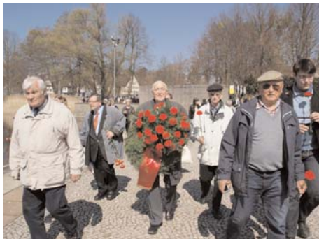
Die AG 60plus bei der Kranzniederlegung in Ravensbrück.

Für die AG 60plus Berlin ist die Teilnahme an dieser Gedenkveranstaltung seit mehr als 10 Jahren Tradition. Hier kommt es Jahr für Jahr zur Begegnung mit ukrainischen Frauen aus Simferopol (Krim), die bis