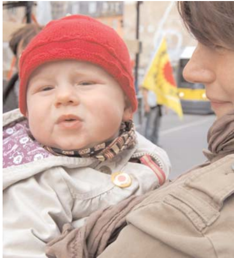
Das Ziel: Gut behütet aufwachsen

Unterschiedlichste Maßnahmen sollen durch Prävention, Früherkennung, Bera-