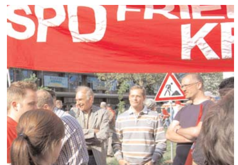
Viele Berliner SPD-Mitglieder werden - wie hier beim 1. Mai 2009 - am Demonstrationszug teilnehmen.

Die SPD setzt sich für eine Begrenzung der Leiharbeit, für mehr Mitbestimmung, flächendeckende Mindestlöhne und einen sozialen Arbeitsmarkt ein. Der DGB warnt in seinem Aufruf: „Die Krise ist noch nicht vorbei. Gewerkschaften und Betriebsräte