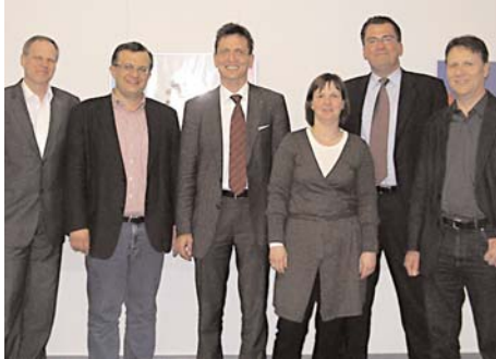
Charlottenburg-Wilmersdorf: der neue Kreisvorstand.