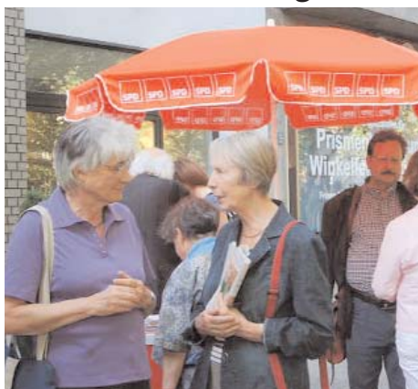
Mehr „Wir im Kiez“: Infostandaktion der Charlottenburger SPD.

Ich fühlte mich eingeschüchtert und gehemmt. Schon die Sitzordnung wirkte auf mich, die ich mich noch nicht seit Jahren oder Jahrzehnten an den altherwürdigen Strukturen und Parteigebräuchen abarbeitete, verkrampt: Vorne thronen die Funktionäre, während sich unten und vor ihnen wie Schüler (wie Wähler?) die restlichen Mitglieder versammelten. Als müsse noch