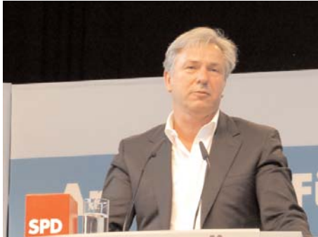
Klaus Wowereit leitet die Zukunftswerkstatt „Integration – Einstieg und Aufstiege in Deutschland“ der Bundes-SPD.

Der Neuköllner Bezirksbürgermeister Heinz Buschkowsky berichtete von den Projekten im Bezirk, lobte die Berliner Reformen im Bildungsbereich und mahnte zugleich die Bereitschaft zur Integration an. Shermin Langhoff, Leiterin des Ballhau-